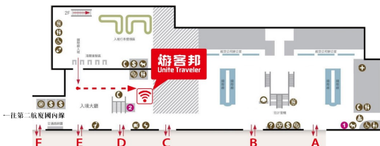
【台北松山機場】第一航廈國際線 1F